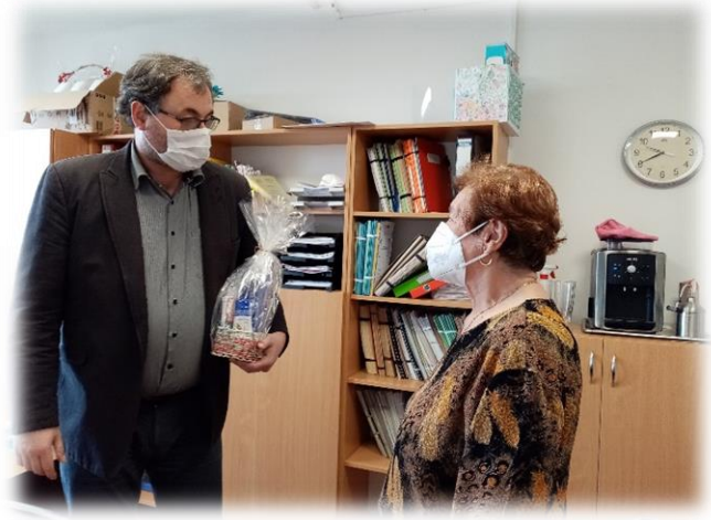
Odovzdávanie ceny a káva s pánom riaditeľom