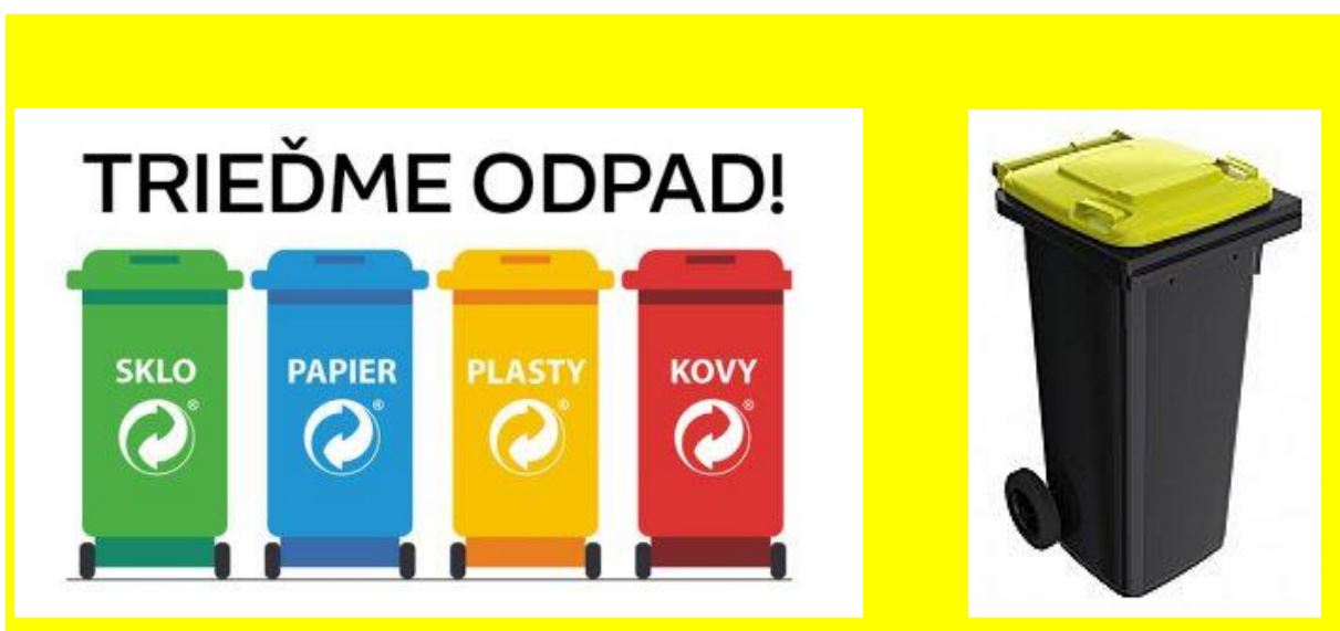
Ilustračný obrázok