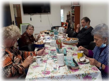
Rozvoj pracovných zručností