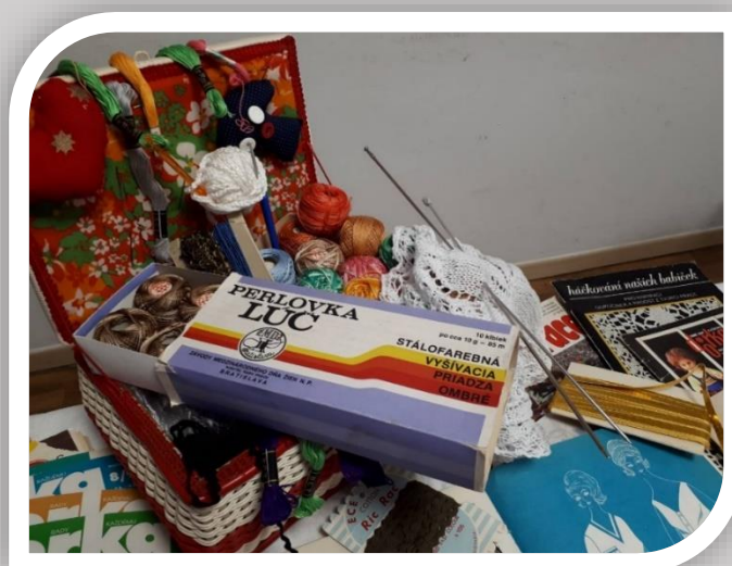
Ilustračná fotografia – pomôcky v miestnosti na rozvoj pracovných zručností