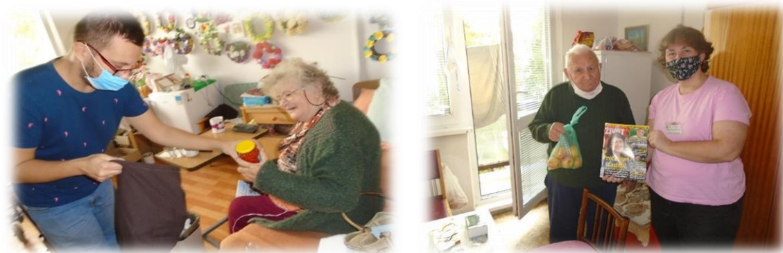
Odovzdávanie nákupu podľa želania obyvateľov

Napriek tomu, že naši obyvatelia majú možnosť celodenného stravovania, v prípade záujmu, príslušní zamestnanci zariadenia zabezpečujú pre nich i drobné nákupy. Vaša spokojnosť je najlepším ohodnotením našej práce.