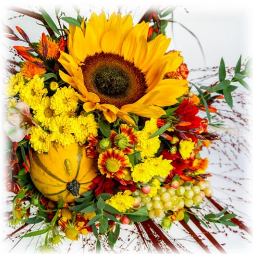
Ilustračný obrázok

„Všetko dobré k Vášmu sviatku, prijmite naše želanie, nech Vám šťastie, zdravie, láska nablízku vždy zostane.“