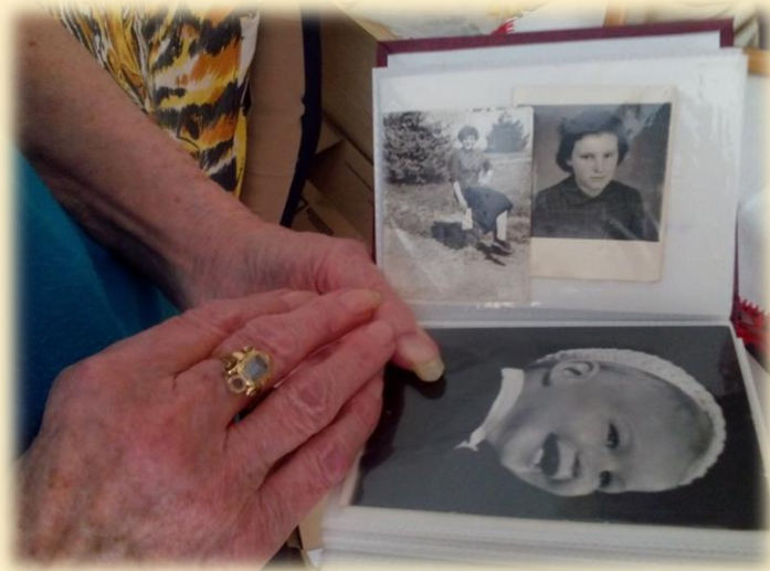
Obľúbené prezeranie rodinných fotografií

„Spomienky sú jediným rajom, z ktorého nás nemôžu vyhnat’.“