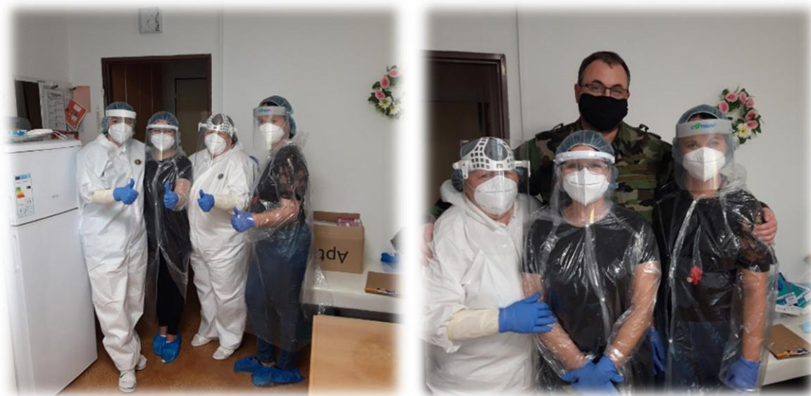
Fotografie zo dňa 31.10.2020 – príprava tímu na testovanie v „PENZIÓNE“