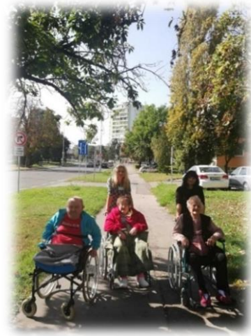
Spoločná fotografia obyvateľov v doprovide pracovníkov „PENZIÓNU“